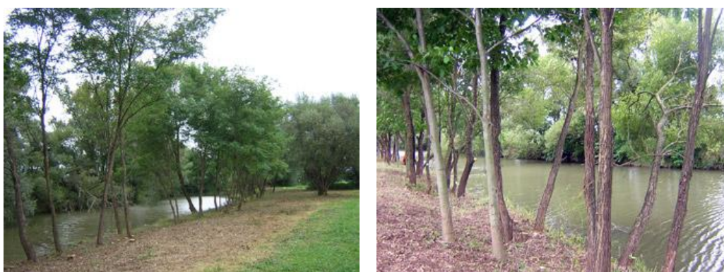
Horvátlovői Pinka szakasz

(Fogható halak: 1,5-3 kg-os pontyok, 0,1-0,5 kg-os kárász, keszeg, Átlag mélység: 2 m)