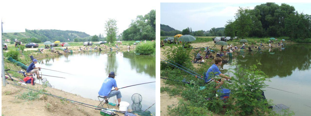
Vaskeresztesi Pinka holtág

(Fogható halak: 1,5-3 kg-os pontyok, 0,1-0,5 kg-os kárász, keszeg, Átlag mélység: 2 m)